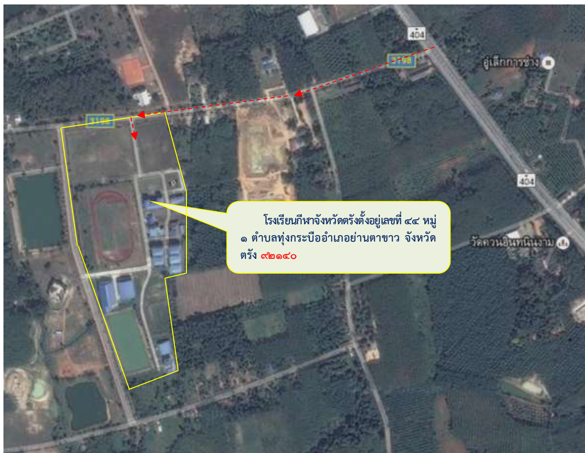
ภาพที่ตั้งโรงเรียนกีฬาจังหวัดตรัง